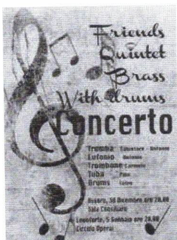
WhatsApp Image 2021-12-22 at 21.15.21 (1).jpeg